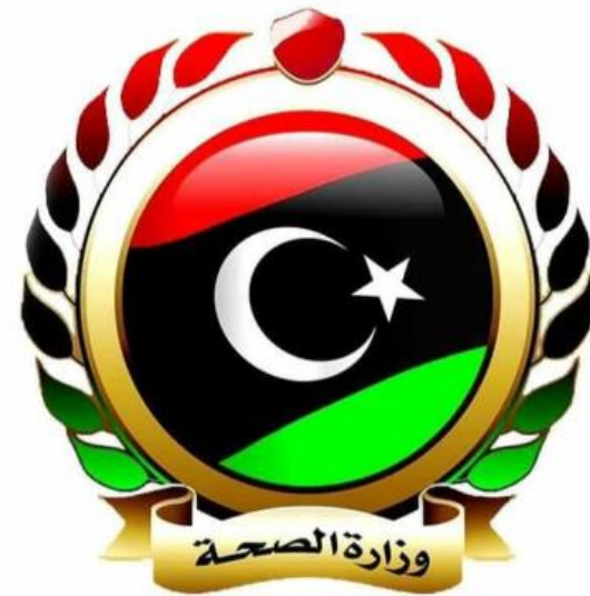
Ministry of Health