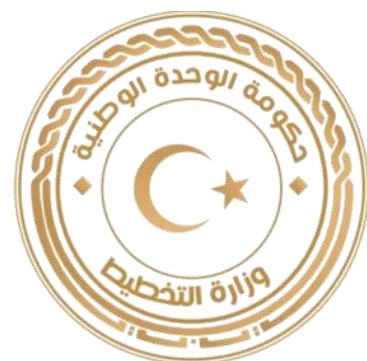
Ministry of planning