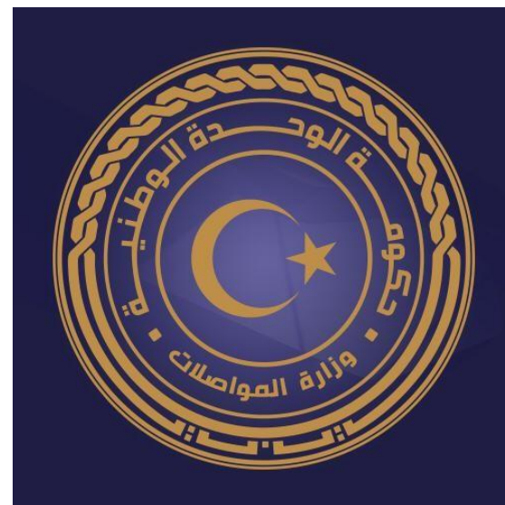
Ministry of transportation

جهاز مشروعات الاسكان والمرافق Housing and Infrastructure Board