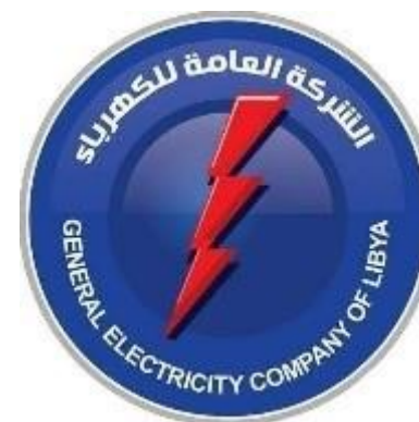
General Electricity of Libya